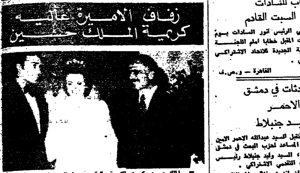
زفاف الامير حبيب كريمة الملك الحسن الثاني

الملك حسين وكريمة الابيرة علي قريسيها السيد ناصر ميرزا خسر حفلة الزفاف مساء امس الاول ( صورة ياراوي من امير ) احتفل في الاردن مساء امس الاول بزفاف ابنة عمه كريمة الملك حسين الى السيد ناصر ميرزا . وبدا الاحتفال بتحيةة موكبه الموريسين الهوائية في الساعة الخامسة والنصف من بعد الظهر ، مختتمت سوارح العاصمة . وكانت الفرق الفنية تحتل نصف الساحة المشحونة ، التركت تل الموريسين ، بينما اصبح التسبب على طول الطريق التي تسلكها المركبة . وادى وصول موكب الموريسين السريحة فسر وغان كان عدد من فرق القوات المسلحة الأردنية ، وهم يحملون السيوف ، يقفون على جانبي المقدم . كما اصطفت موكبة من فرسان الحرس الملكي على جانبي المقدم الداخلي الذي في قمة التتسورانية لكك حسين والموريسين . وبعد ذلك تهل الملك وكريستوس غريسيها ، والاميرة نينا والسيد ميرزا وقريته القهقي من المدعين . عمان - و.س.ف. -